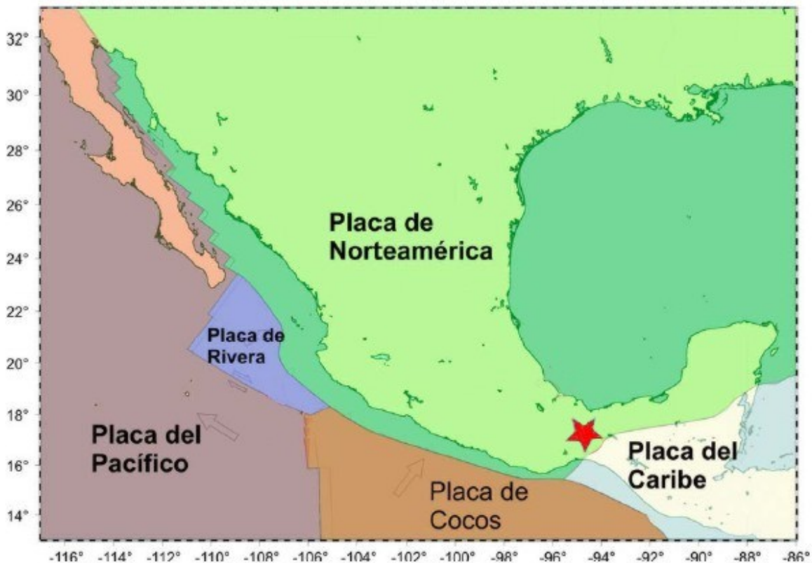
Figura 4. Tectónica de la República Mexicana. La estrella en color rojo indica el epicentro del sismo.

México se encuentra en una zona de alta sismicidad debido a la interacción de 5 placas tectónicas: La placa de Norteamérica, placa de Cocos, placa del Pacífico, la placa de Rivera y la placa del Caribe. Por esta razón no es rara la ocurrencia de sismos. El Servicio Sismológico Nacional reporta en promedio la ocurrencia de 7 sismos por día de magnitud M > 3 .