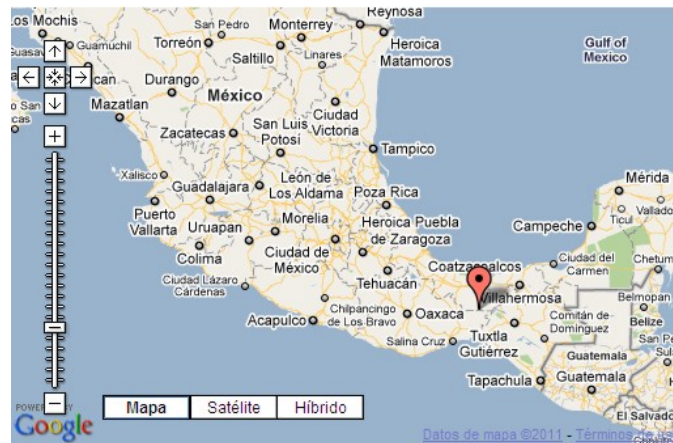
Fig1. Epicentros del sismo.

El día 7 de Abril de 2011 el Servicio Sismológico Nacional reportó un sismo con magnitud 6.7 localizado en el Istmo de Tehuantepec, a 83 km aproximadamente al Suroeste de Las Chopas, Veracruz, en el Istmo de Tehuantepec. El sismo ocurrió a las 8:11 horas, tiempo del centro de México. Las coordenadas del epicentro son 17.20 latitud N y 94.34 longitud W (Fig. 1). La profundidad del hipocentro es 167 km. Hasta el momento de la emisión de este reporte no existen reportes de daños. Sin embargo, sí fue sentido en las regiones cercanas al epicentro e incluso en la Ciudad de México.